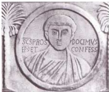
Bassorilievo di S. Prodocimo "vescovo e confessore"

Le divergenze sono sul tempo. Qualcuno dice che sarebbe stato mandato nel Veneto da s. Pietro, il primo papa. Allora la sua vita si dovrebbe porre verso la fine del secolo I e la morte di santa Giustina nella persecuzione di Nerone, del 79 dopo Cristo. Altri pongono la morte di Giustina nel 304, nella persecuzione di Diocleziano, e allora la vita di Prodocimo sarebbe stata tra la seconda metà del 200 e i primi decenni del 300