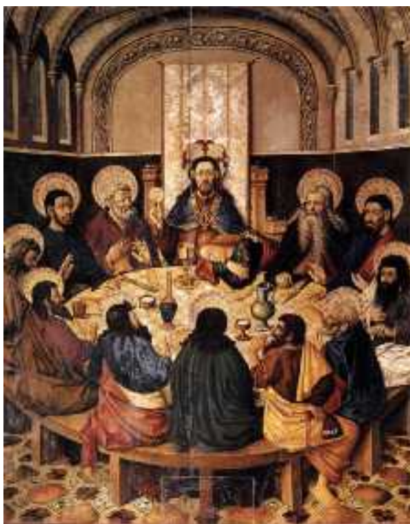
Ultima Cena di Jacomart Jaume (1411 - 1461)

Lo stesso invito il re lo ripete per noi: Gesù durante la Cena