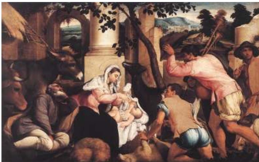
Adorazione dei Pastori di Jacopo da Bassano (1515-1592) olio su tavola Inghilterra, Castello di Windsor

giorni?". Domandò: "Che cosa?". Gli risposero: "Tutto ciò che riguarda Gesù Nazareno, che fu profeta potente in opere e in parole, davanti a Dio e a tutto il popolo; come i sommi sacerdoti e i nostri capi lo hanno consegnato per farlo condannare a morte e poi lo hanno crocifisso. Noi speravamo che fosse lui a liberare Israele; con tutto ciò son passati tre giorni da quando queste cose sono accadute... Ed egli disse loro: "Stolti e tardi di cuore nel credere alla parola dei profeti!